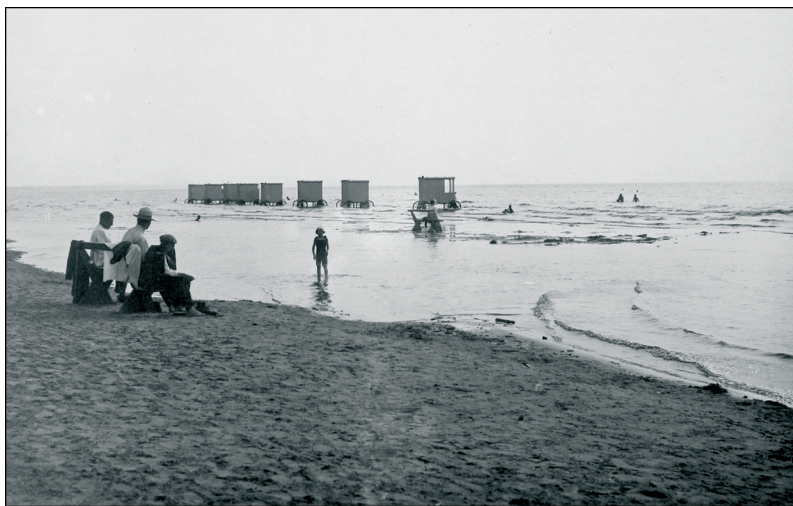
Foto 1. Supelvankrid Narva-Jõesuu rannas enne I maailmasõda. ERM Fk 1523: 347.

Paraku sundis sündsustunne suplejatele riided selga, alternatiivne võimalus oli naiste ja meeste supluse ajaline või ruumiline lahku viimine, mida rakendati paljudes randades. Üheks kõige iseäralikumaks meresupluse korraldamise abinõuks oli 18. sajandil kasutusele võetud supelvanker – merre veetav ratastel riietuskabiin, kus supleja sai lahti riietuda ja otse vette astuda. Mõnes kuurordis olid supelvankritel riidest kattevarjud, mis kaitsesid suplejaid (eelkõige naisi) uudishimulike pilkude, aga ka päikese eest. Nii võis riieteta hakkama saada, aga paljudel juhtudel ootas suplejat vankris ka kuiv