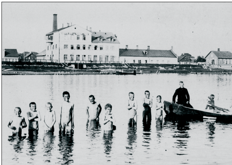
Foto 8. Probleeme tekitasid inimesed, kes suplesid alasti selleks mitteettenähtud kohas. Poisid Tartus Emajões 20. sajandi algul.

Etiketiraamatud ning kuurortide käsiraamatute juhised võivad varjutada hoopis vabamat suplusviisi, kus muretseti vähem süüdsuse ja privaatsuse pärast. Nii fikseeris 1849. aasta kohtuprotokoll, kui-