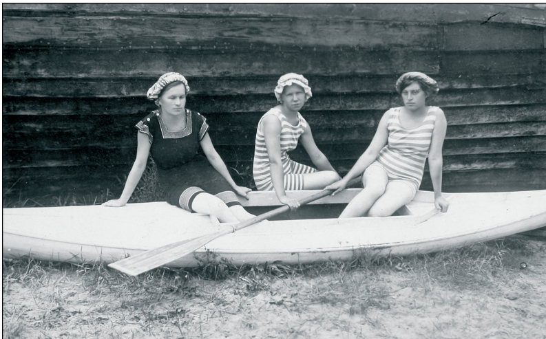
Foto 6. Naiste supelkostüüm ei olnud täielik peakatteta. Pirita 1913. ESM F 362: 36.

Sporti- ja moeajalood jutustavad naistest, kes võitlesid naiste õiguse eest sportida ning aitasid kaasa sportliku riietuse aktsepteerimisele. Naiste ujumise Jeanne d’Arcina esitatakse Austraalias sündinud Annette Kellermanni, lastehalvatust põdenud neiu, kes uju-