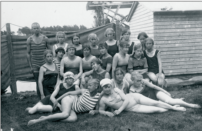
Foto 7. Supeltrikoo oli halastamatu, selles oli raske midagi varjule jätta. Pirta 1918. ESM F 361: 143.

line daam säilitab ka rannas väarikuse, minnes suplema, mitte oma võludega uhkeldama. Mõistetavalt ei saa ujujad elegantsile ja esteetikale tähelepanu pöörata ning peavad trikood kandma. Tüüpilist daami supelülrikonda kirjeldab Suttner kui tagasihoidlikku musta või tumesinist, taftist või siidsaržist kaheosalist komplekti, mis koosneb kellakujuliselt kehasse töödeldud või volditud alläärega pluusist. Selle all kantakse pükse ning musti või valgeid sukki, kui ei soovita kasutada võimalust paljajalu rannas olla. Paraku on elegantse supelkostüümi korras hoidmine jõukohane vaid vähestele daamidele. Suttneri arvates just see sunnib naise haarama trikoo järele, mis näeb tema arvates tavaliselt veelgi halvem välja kui kortsus supelkostüüm. Tema hinnangul võis kõige rohkem lihtsaid ja lausa nappe supelkostüüme näha Saksa, kõige rohkem koketseid komplekte Prantsuse ja tagasihoidlikke Inglise kuurortides (1914: 119–120). Kahtlemata oli suur vahe luksus- või provintsi kuurordis, kuurordis või vaikes supelkohas kantaval riietusel. Kirjeldades ettevalmistusi Mereküllä sõiduks märgib Theophile von Bodisco: “Kuna see oli kuurort, pidid mul ilusad riided olema ja ma kutsusin oma õmbleja Kovalenko”, ning kirjeldab valmistatud kleite ja kostüüme, mille seas ta ei maini supelriideid (1997: 223). Naiste ja meeste eraldi sup-