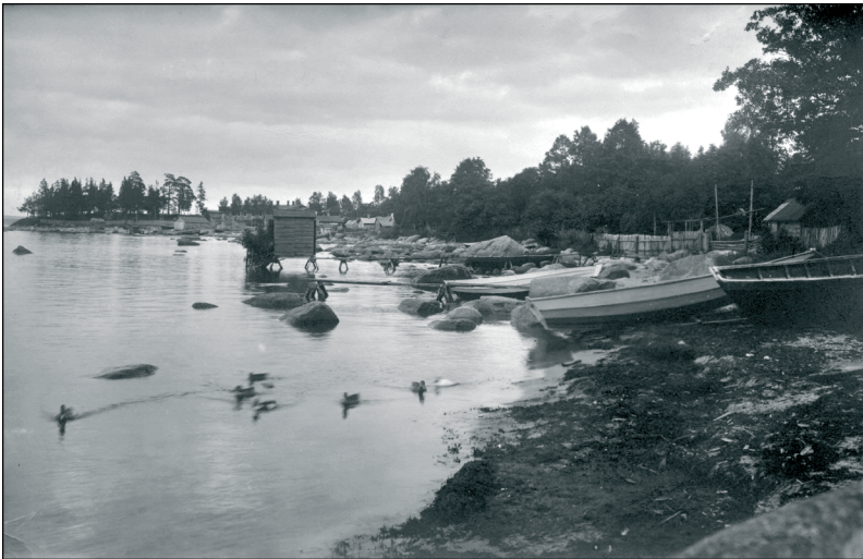
Foto 2. Supelonn Käsmu rannas. Kaseoksad varjasid vette minevat või veest välja tulevat suplejat uudishimulike pilkude eest. Foto J. Christin, 1913. ERM Fk 167: 18.

Eesti kuurortides oli ülemöödunud sajandil sooliselt eraldatud suplus valdav – meestele ja naistele olid eraldi supelrajatised või erinevad supelajad. Aleksandr Miljukovi 1849. aasta reisikirjast võime lugeda tema muljeid Tallinna supeloludest: “Vannid on ehitatud [Kadriorus] otse lahte, küllalt kaugele rannast ja nende juurde pääseb vetruvate laudsildade kaudu. Vasakul on meeste supelhoone, paremal naiste supelhoone. Aga ärge tundke muret kauniste najaadide häbelikkuse pärast: nad on täiesti kaitstud, sest vahemaa on võetud pikksilma järgi, nii et uudishimulikult pilgule pole vähimatki välja vaadet. [...] Milline nauding on supelda põhjatuulega, kui rohekad kõrglained veerevad reastikku kalda poole, haaravad teist kinni ja kiigutavad, paiskavad teid alla ja viskavad üles, loputavad teil sool-