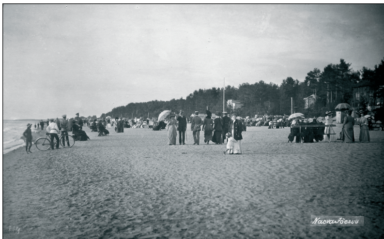
Foto 3. Väljaspool supelaega viibiti rannas tavalistes tänavariietes. Narva-Jõesuu plaazil oli õhtul suplemine keelatud, siis jalutati ja kuulati muusikat.