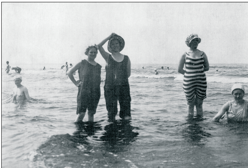
Foto 4. Naiste ja meeste supluse lahkuviimine võimaldas supelda alasti, kuid 20. sajandi algul oli üha rohkem neid, kes kasutasid supelriideid. PäMu F 3117/31.

19. sajandil meil kirevat rannaelu ei kujunenud. N. Ey ütles 1894. aastal Riia ranna kohta, et see meenutab pigem suvituskoha kui me-