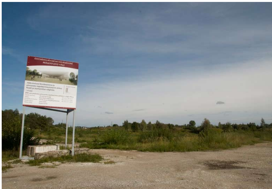
ERMi uue hoone alad Raadil.

Uue hoone tutvustamiseks toimus mitmeid sündmusi. Juunis valmis koostöös Tartu Lastekunstikooliga Raadi mõisaparki ERMi uue hoone 20-kordselt vähendatud makett-mänguväljak ning ERMi näitusemajas ja ERMi Postimuuseumis sai vaadata uut hoonet tutvustavat näitust „ERM 101_uus hoone“.