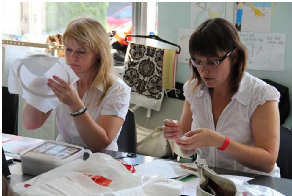
MTÜ TuleLoo käsitöökolmapäev ERMi näitusemajas.

Täiskasvanuhariduses toimusid teoreetilised ja praktilised täiendkoolitused rahvakultuuriteemadel. Projekti Käsitööga tööle ning mitmete kursuste ja infopäevade kaudu toetati ERMi kogude põhjal sündinud kaas-aegset tootedisaini ning loomemajandust.