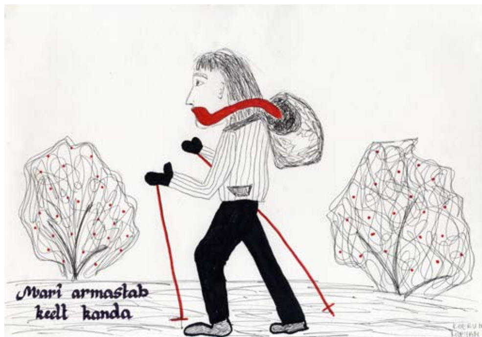
Näituse „Muuseum näitab keelt“ raames joonistati keelekujundeid.

ERMi püsinäituse „Eesti. Maa, rahvas, kultuur“ raames toimusid traditsioonilised ekskursioonid ja giidiprogrammid eesti rahvakultuurist ja omaegsest elu-olust, kuhu lisandus uuena puidukäsitöö teemaline programm „Puu-aastaring“.