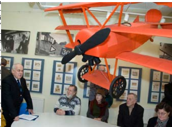
Postilennuk näitusel „Eesti õhupost 90“.

Lisaks pakub muuseum erinevaid programme, erinevas vanuses külastajatele. Lasteaialastele ja kooliõpilastele korraldatakse programme, mis tutvustavad postitööd ja kirjasaatmist. ERMi Postimuuseum osaleb aastaringi erinevatel Tartu linna üritustel,