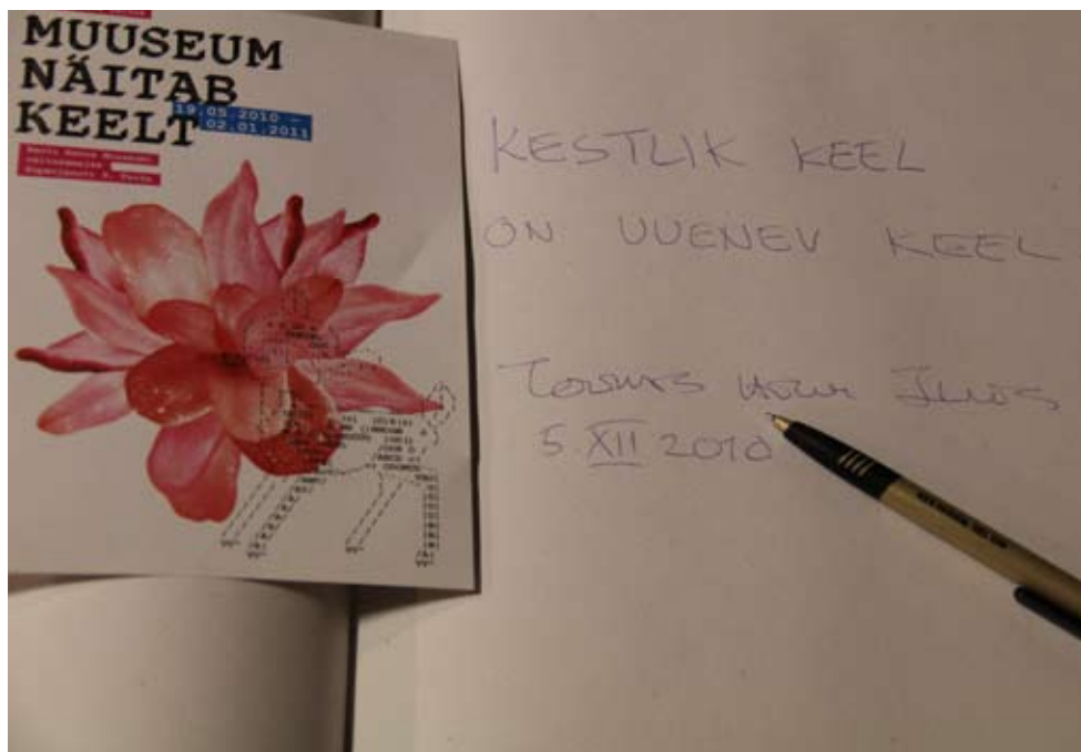
Detsembris külastas näitust „Muuseum näitab keelt“ Eesti Vabariigi president Toomas Hendrik Ilves.