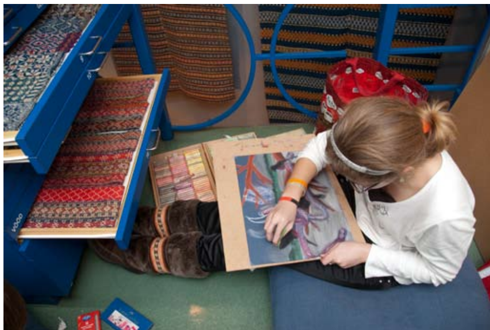
ERMi püsinäitusel „Eesti. Maa, rahvas, kultuur“ toimub iga-aastane võistujoonistamine.