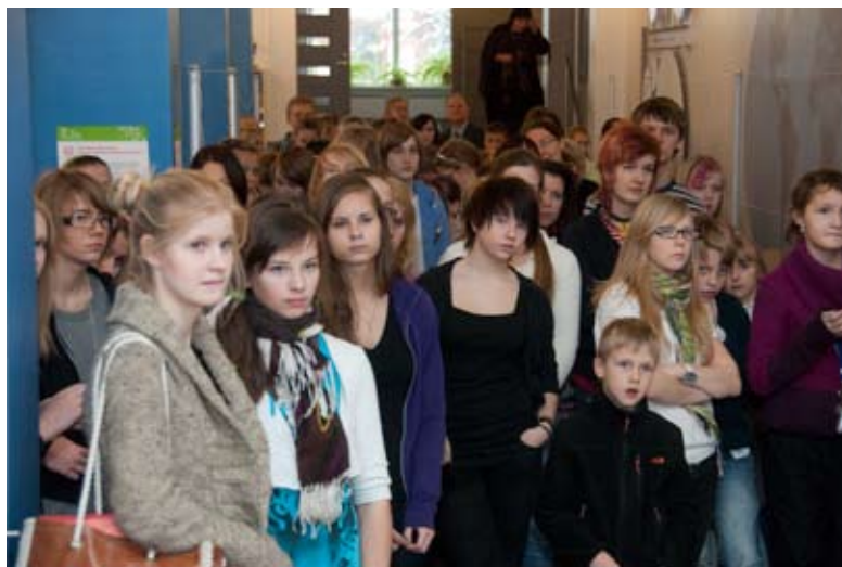
Koolidevahelise võistujoonistamise osalised ootamas joonistamise algust.