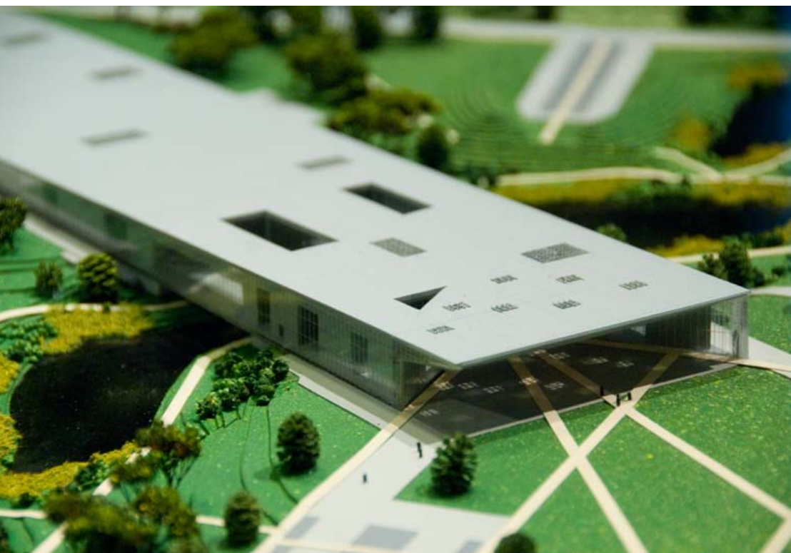
ERMi uue hoone ja alade makett.

2010. aastal toimus Raadi alade ettevalmistamine ehituseks, nende välisilme muutus märkimisväärselt. Aasta alguses lammutati endised sõjaväe autobaasi varemed, SA Keskkonnainvesteeringute Keskuse toetusel