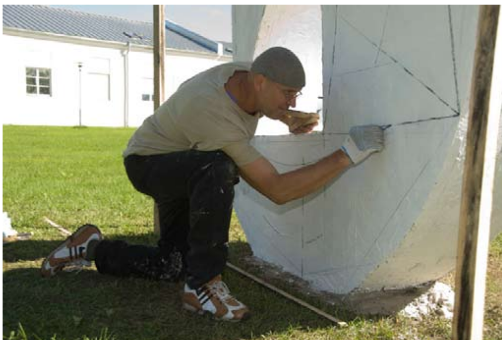
Rahvusvahelise skulptuurisümposiumi „Lühiajaline Suuremõõtmeline“ raames valmisisid nädalaga 6 kunstniku Eestist, Saksamaalt, Ungarist ja Inglismaalt tööd Raadi mõisapargis.