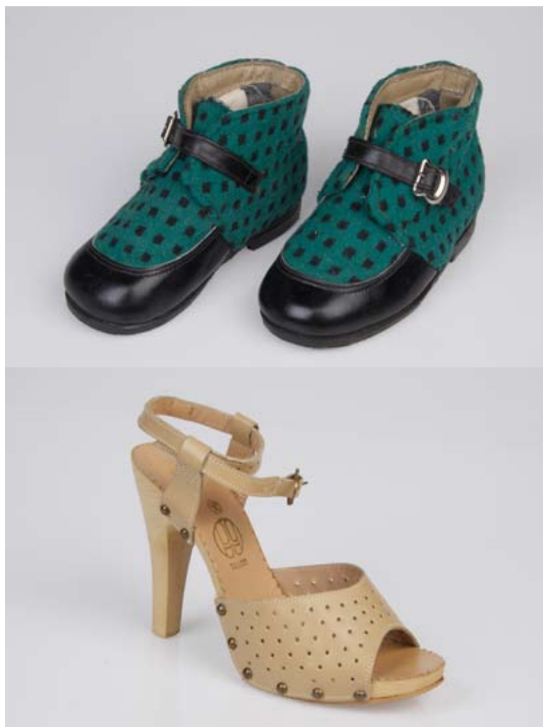
Näiteid Naha- ja Jalatsikombinaadi Kommunaar toodangust kogus A 993.