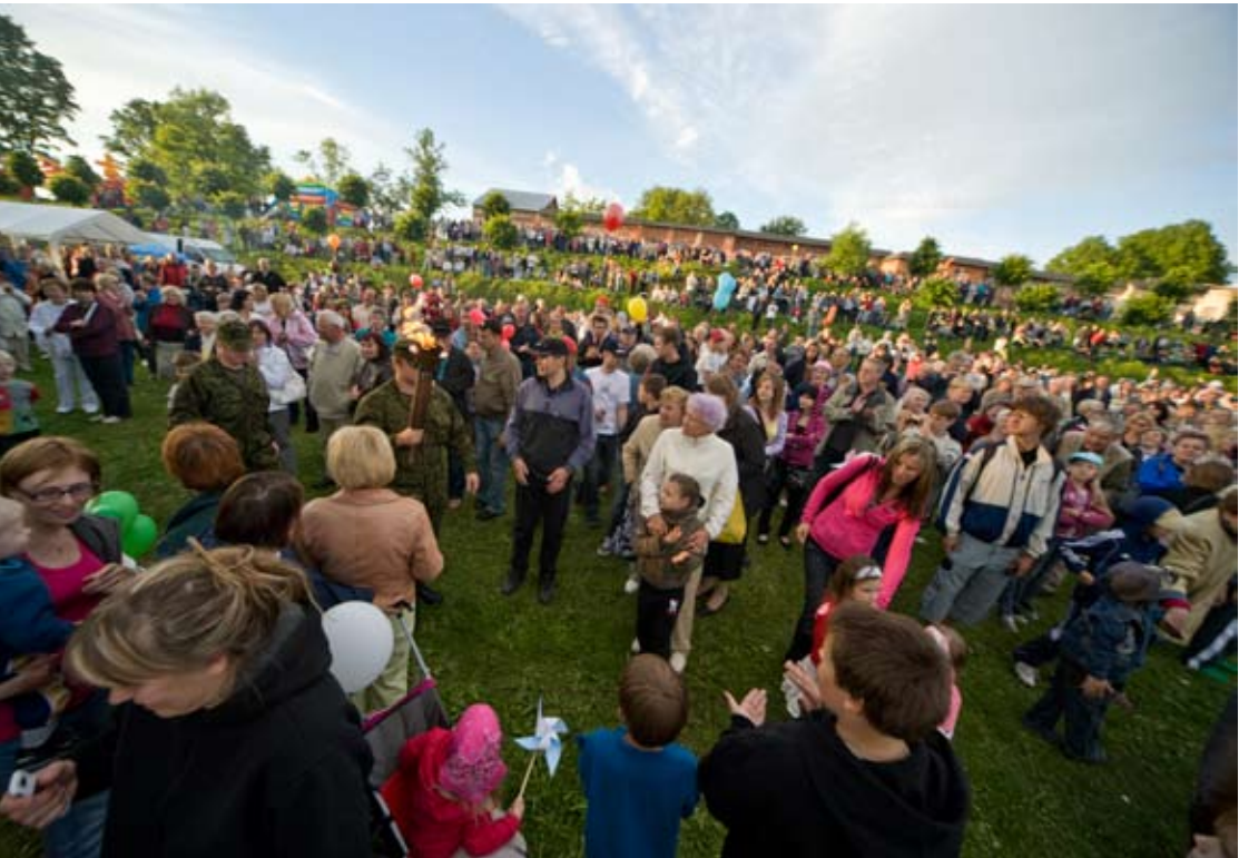
23. juuni 2010 Raadil. Kaitseliidu Tartu maleva esindajad süütavad võidutulest Tartu linna jäänitule.

Koostööd arendati Soomest, Kotka Merekeskus Vellamo sõprade seltsiga ja tartlastest välismaalastega, kes on koondunud SA Domus Dorpatensise ümber. 2010. aastal käidi õppereisidel Baierimaal, Latgales ja Eestimaa väikesaartel Pedassaarel ja Mohnil. Aasta võeti kokku tutvumiskäiguga Mooste mõisa.