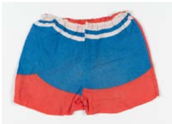
ERM A 1056:39