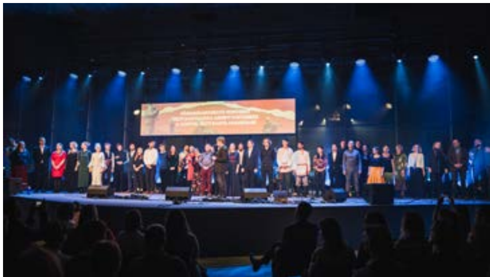
Pärimusmuusikute kontsert Eesti Rahvaluule Arhiivi toetuseks.