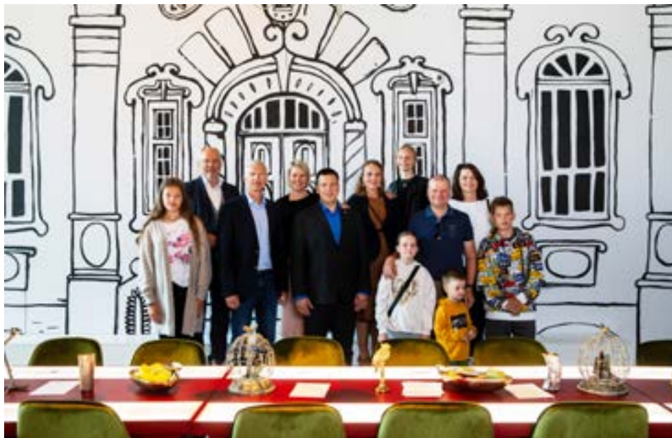
Ehkki välismaiseid külastajaid muuseumis eriti ei käinud, toimus ERMis siiski kolme Balti peaministri kohtumine.