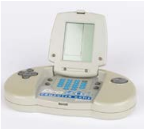
ERM A 1056:42

Põnevamatest üksikesemetest jõudsid muuseumisse 1990. aastate alguses Eesti NSV lipust õmmeldud suvepüksid, mille kohta valmistaja ütles, et „poes oli kaupa vähe, aga ENSV lippe oli palju ja nad hinnati odavaks, võisid olla ka kaks-kolm kopeikat hinnaga“. Lisandus mitmeid esemeid, mis dokumenteerivad eri künnendeid, sh näiteks 1980. aastatest pärit siiditrukiraam, millega kodumaised Maratis valmistatud T-särgid muudeti Adidase omaks. 1990. aastate teismeliste unistusi kajastab postimüügi-kataloogist ostetud arvutimängukonsool (nn Tetrise mäng). 2000. aastate esimesi künnendeid iseloomustab multifilmi- ja arvutimängukangelaste jõudmine nii T-särki-dele kui ka aluspesule.