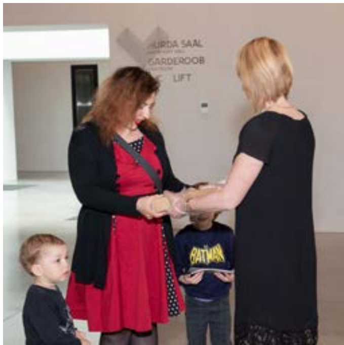
Esimesed külalised võeti vastu kingitusega.