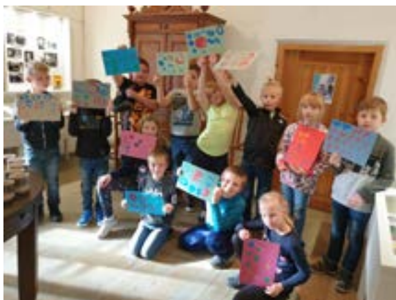
Kalmetu Põhikooli õpilased teevad muuseumitunnis kartulitrükki.