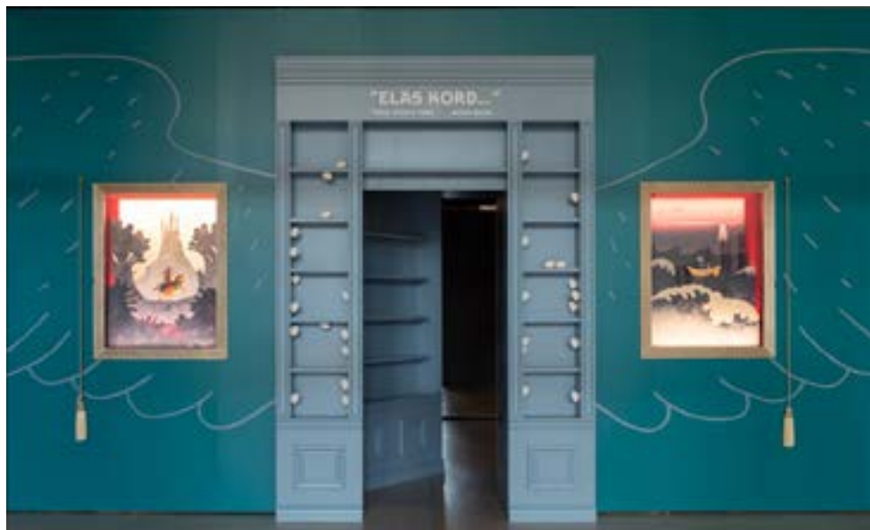
Nendest uuest avanes populaarse muinasjutunäituse „Elas kord...“ fantaasiamaailm.