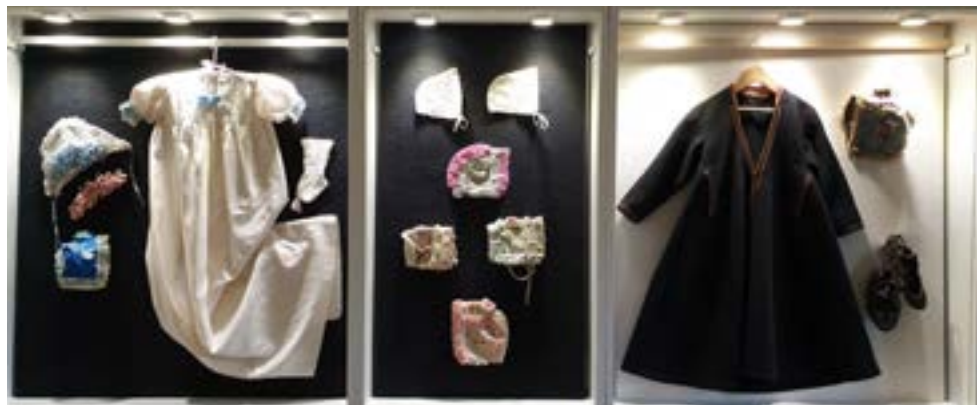
Näitus „Ristimise kaudu ristiinimeseks“ ERMi Heimtali muuseumis.