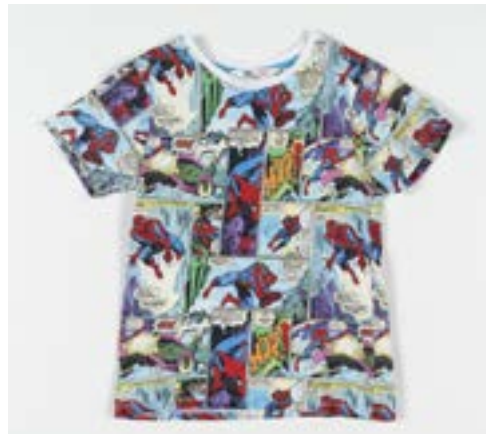
ERM A 1058:9