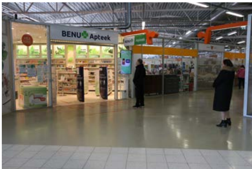
Lahti olid ainult toidupoed ja apteegid, kuhu tohtis siseneda ühekaupa ja kus tuli hoida kahe-meetrist vahet.