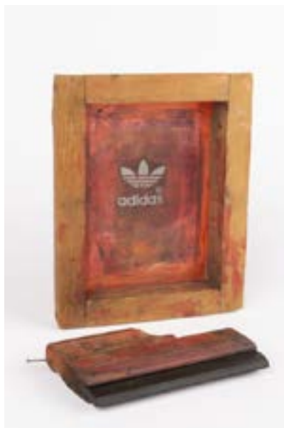
ERM A 1056:83/ab