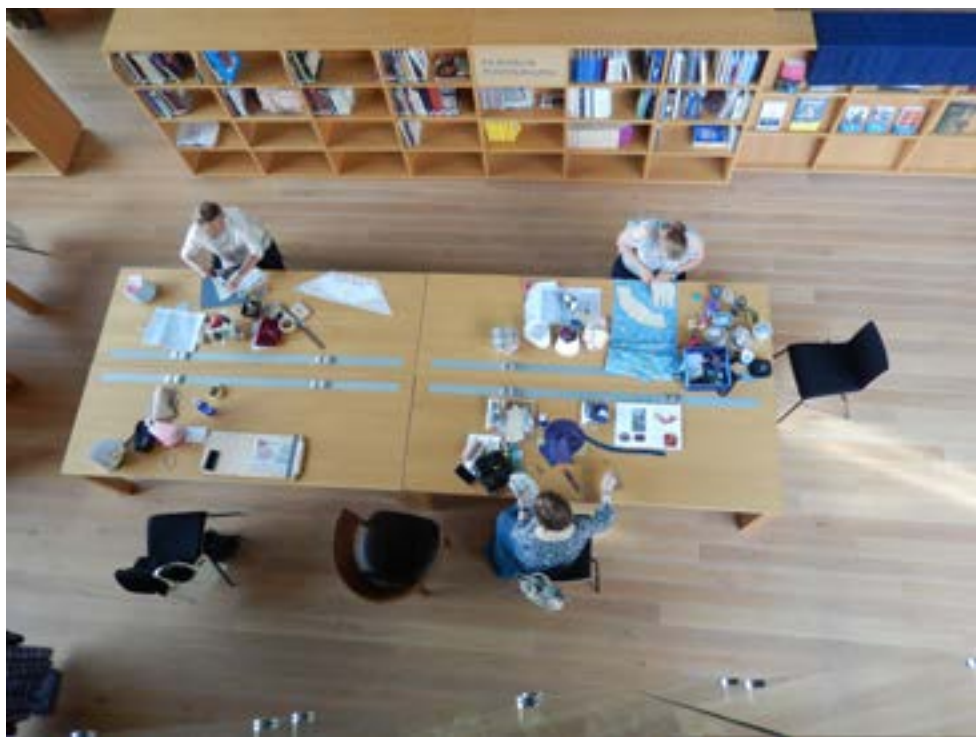
Pottmütsi valmistamise õpituba raamatukogus