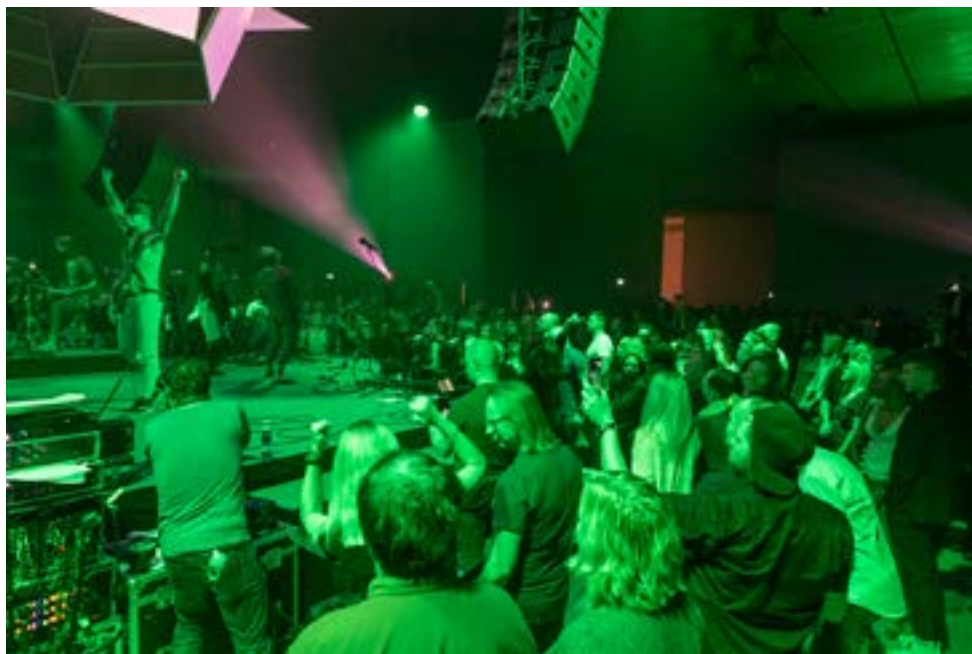
ERMi ÖÖ 2020 täis lakkamatult voolavat loomeenergiat nii tules, videos, valguses kui ka helis.