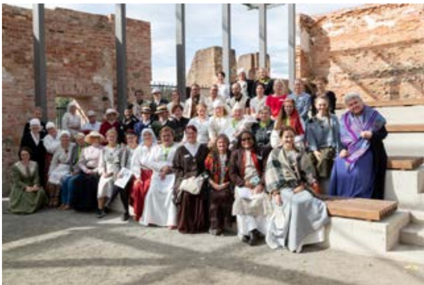
Konverentsil „FREEDOM in/to Time Travel. Can We See the Future?“ sai osa võtta ka 1869. aasta ajarännakust.

Aasta teine pool tõi meile kaks olulist autasu – kultuurikursus „Ela eestlaste elusid“ sai tunnustuse „Tartumaa aasta õpitegu 2020“ täiskasvanuhariduse valdkonnas ning Muuseumirott 2020 auhinna muuseumihariduse kategoorias.