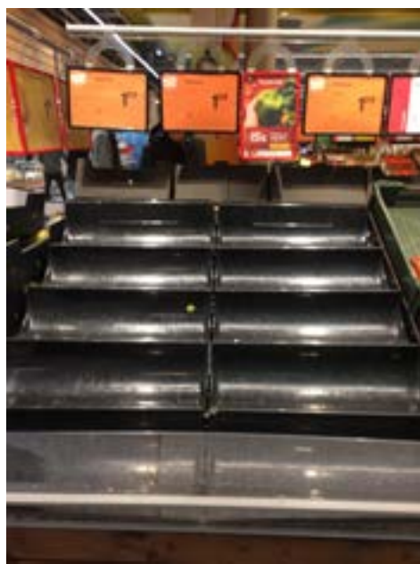
Koroona teemalist materjali hakkas ERM koguma kohe märtsis. Esimese laine ga tühjaks ostetud poeletid.

ERMi teadustöötajad pidasid ettekan- deid ligi 20 teaduskonverentsil, ilmus 15 teaduspublikatsiooni ja 45 populaartea- duslikku artiklit (teemaks mälu-uuringud, toidukultuur, museoloogia, teadusajalugu, rahvakultuur ja COVID-19 mõju argikultuu- rile). Peeti populaarteaduslikke ettekan- deid ja esineti meedias enam kui 35 korral, täien- dati muuseumikogusid nüüdisaja argielu materjalidega Eestist ja Siberist, osaleti eks- perdina programminõukogudes ja komis- jonides, juhendati uurimistöid, peeti üle 50 loengu ERMis ja ülikoolides ning korraldati museoloogia täiendõpet.