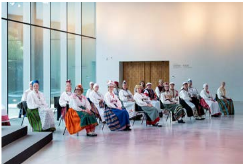
Rahvarõivakooli VIII lennu lõpetamine.