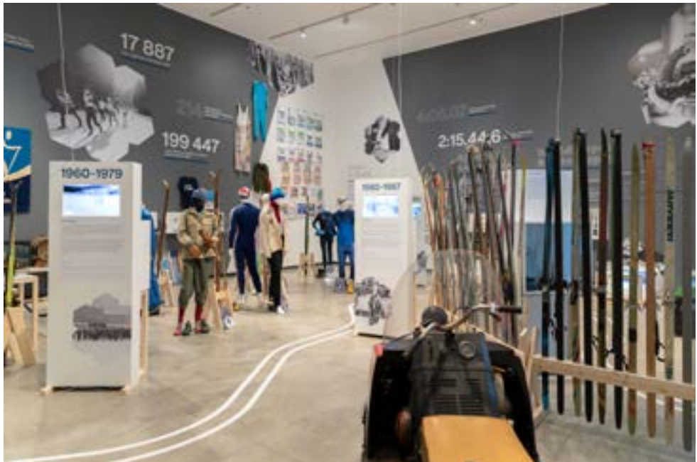
Osalussaali näitus „Tartu Maraton 60“.