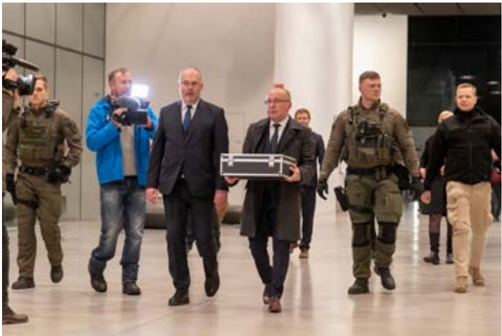
Tartu rahulepingu originaal jõudis Rahvusarhiivist ERMi EV100 lõpuüritusele.

Traditsiooniliselt toimus Tartu linna aukodanike austamisõhtu ja Tartu valla Eesti Vabariigi sünnipäevale pühendatud kontsert ERMi sillal.