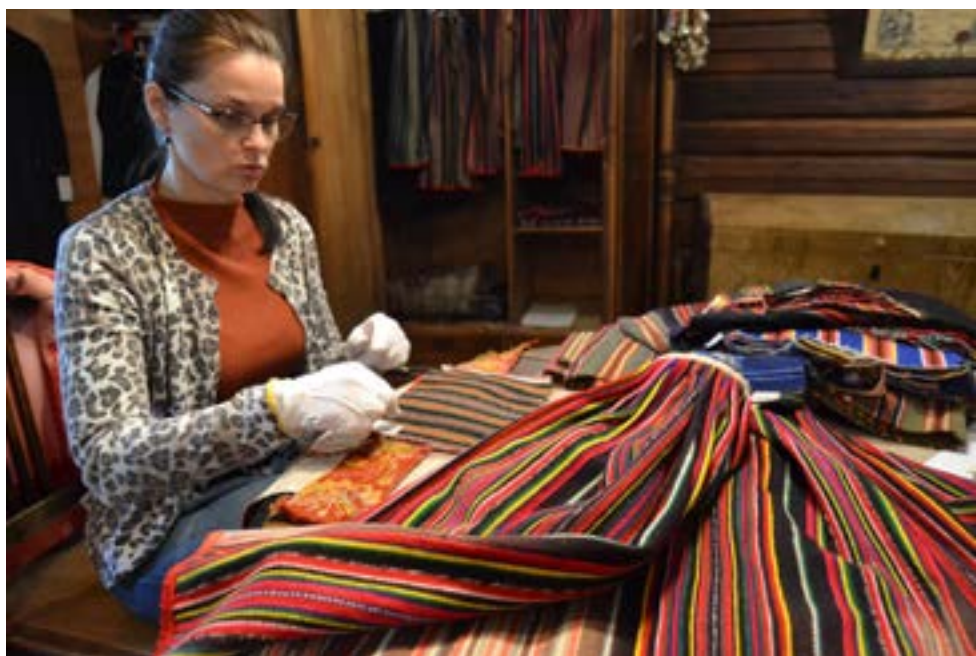
TÜ VKA rahvusliku tekstiili tudengitele mõeldud vanade tekstiilide konserveerimispraktika Heimtali muuseumis 3.–7. augustil 2020.

Kogude hoolduses oli eriolukorra ajal paus, aga museaalide planeeritud kontroll ja hoiustussüsteemide puhastus sai tehtud. Varem pildistatud H56 siidilintide kogu pakendati ümber ja magasineeriti, nii et need on nüüd arhiivipüsivast kartongist rullil ja kaetud siidipaberiga. Puuvillasest riidest õmmeldi kaitseümbrised kottidele (H53 XI, XII). Arhiivipüsivatesse ümbristesse pakendati tooli- ja diivanikatted, Haapsalu sallid, H53-s albumid, auaadressid, vimplid ja laualipud. Viis suurt albumit pakendati Tyvekisse (polüetüleenkiududest kangasse) ning kunstmaterjalist kaantega auaadressid Melinexi kilest õmmeldud taskutesse. Signeeriti tulme ja TMi esemed. H53 TM E tekstiil- ja nahkesemed pakendati, magasineeriti, koostati nimekirjad, hinnati seisund ning märgiti MuLSi. Toimus ka segamaterjalide hoidla plastikute ning H53 kottide ja käekottide seisundiuuring.