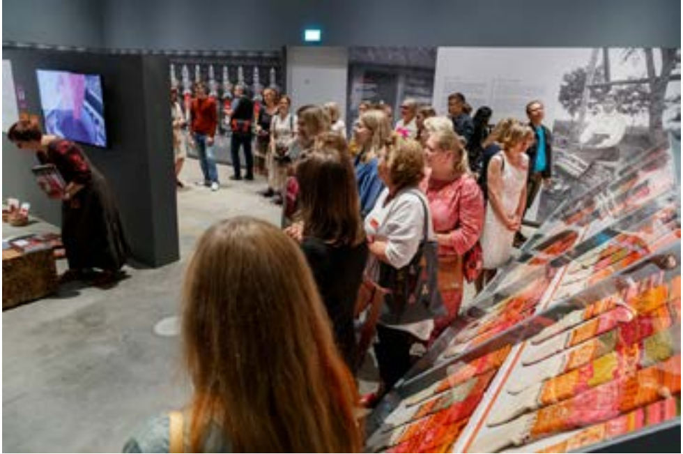
Osalussaali näitus „Meie argipäeva vidussepidamise aeg. Muhu sukad“.