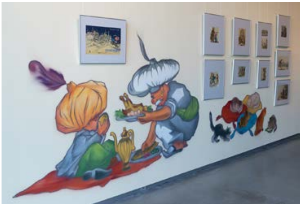
Legendaarse raamatuillustraatori ja plakatikunstniku Siima Škopi originaaljoonistuste näitus.