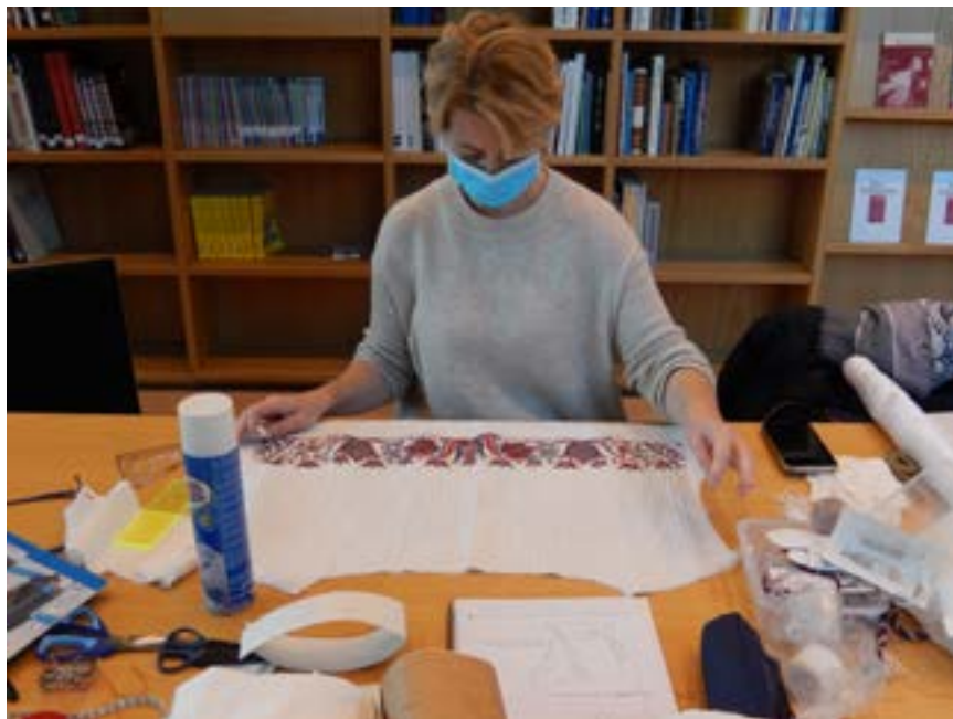
Käiste tikkimine rahvarõivakoolis.