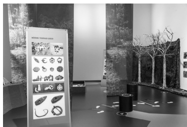
Foto 4. Vaade osalussaali näitusele „Õitsev (aju)vabadus. Noorte elust ja olust 1990. aastate Eestis“.