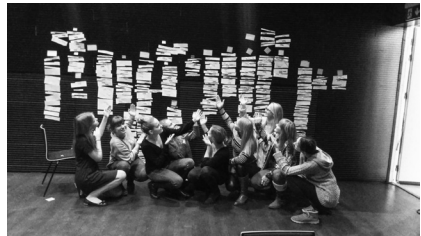
Foto 2. Osalussaali avanäituse „Ajakihid“ kuraatoritest detektoristidega tööprotsessi filmimise välitöödel. Foto Jaanika Jaanits, ERM Fk

Foto 1. Näituse „Õitsev (aju)vabadus. Noorte elust ja olust 1990. aastate Eestis“ ettevalmistamine. HTG õpilased on valinud intervjude ja teiste materjalide läbitöötamise järel teemad, mis näitusele peaksid jõudma. Foto Jaanika Jaanits, ERM Fk