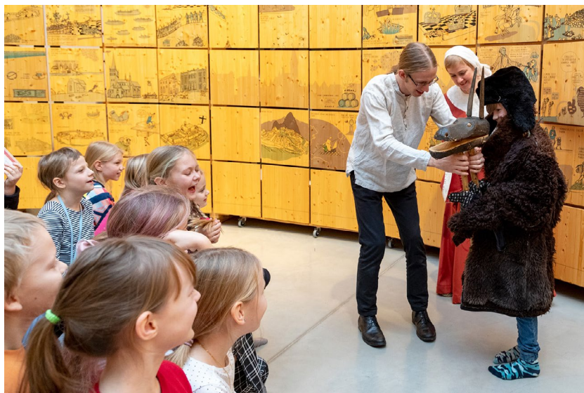
Jõulusoku riietamine laste jõuluprogrammis „Valged jõulud, värvilised jõululood“ toob ikka elevust.

Koostöös Tartu Ülikooli muuseumiga alustas septembris tegevust põhikooli noortele suunatud noorte arheoloogide klubi. Novembris taaskäivitus Tartu Ülikooli psühhiaatriakliiniku ja Tartu mäluasutuste koostööprojekt, mille tegevused algavad jaanuaris 2023. Lisaks loodi hariduskeskuse koosseisu kogukonnasuhete koordinaatorite ametikohad ning valmis lasteraamat „Rännukaru seiklused soome-ugri maailmas“.