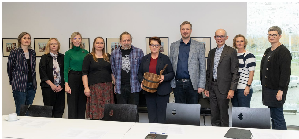
ERMi uus nõukoda.