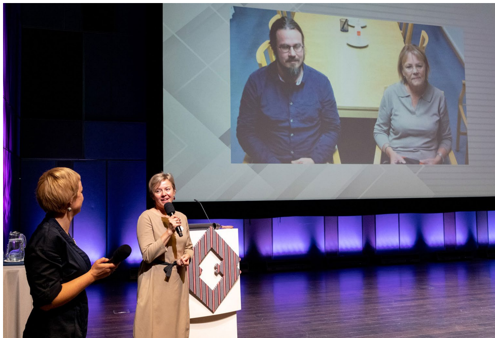
Üle-eestiselisel ajarännakute juubelikonverentsil tutvustavad kolleegid Rootsi Kalmari läänimuseumist videosilla abil oma tööd eakatega.