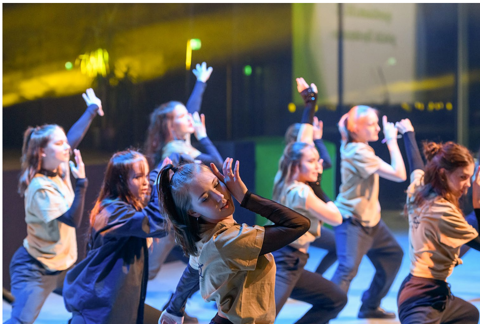
Tantsijad Tartumaa spordiaasta tänuüritusel ERMis.

rence on Physical and Rehabilitation Medicine (korraldajaks Eesti Taastusraviarstide Selts), Forum Ophthalmologicum Balticum 2022, traditsioonilised Õpilaste Teadusfestival, Geenifoorum, Eesti Hambaarstide Liidu, Eesti Geodeetide Ühingu ja Eesti Teadusagentuuri konverentsid. Sõja- ja katastroofimeditsiini konverents ning Eesti Põllumajandus- ja Kaubanduskoja mess haarasid enda alla kogu maja avalikud alad. Lisaks toimus ERMis suur tarkvarakonverents Digit, Maalehe eakate festival, õpetajate infopäev, Tartu koolide lõpuaktused, suurettevõtete jõulupeod, tähistati Eesti Üliõpilaste Seltsi 150. aastapäeva ning toimus rahvusvaheline paberlennukite lennutamise võistlus. Rahvusvaheliste konverentside korraldajad leidsid programmi sees aega ning pakkusid delegaatidele võimalust külastada ERMi näitusi.