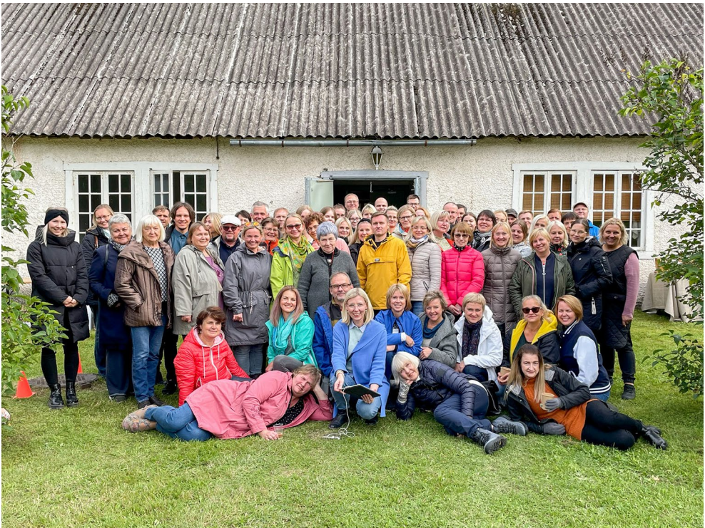
ERMi suvepäevad talgute ja mõnusa koosolemisega toimusid sel korral Heimtalis.

ERM kuulub Lõuna-Eesti turismiklastri, Kultuuritee võrgustikku ning rahvusvahelisse koostööprojekti Singing Heritage Route. Toimub tihe koostöö SA Tartumaa Turismi ja EASI turismiarenduskeskusega ning Tartu linna kultuuriosakonna ja avalike suhete osakonnaga.