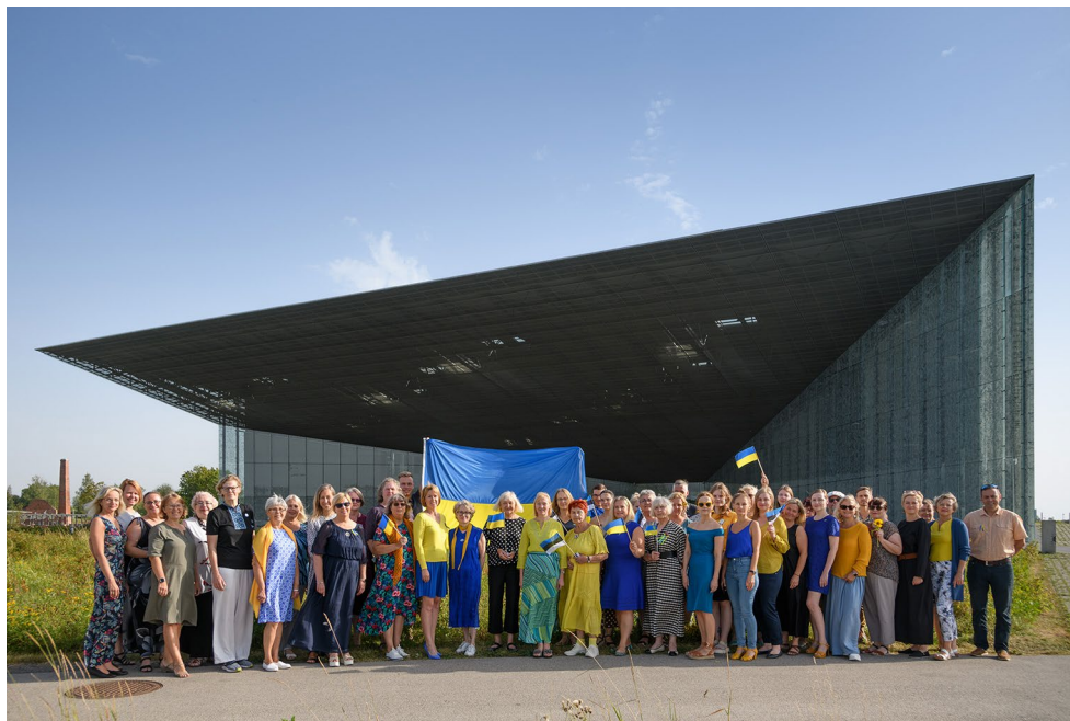
Ukraina iseseisvuspäeval 24. augustil osalesime üleskutses „Ukraina minut“, et öelda: „Ukraina, sa ei ole üksil!“

Euroopa aasta muuseumi auhinna (EMYA) konverentsi ja auhinnagala keskmesse toodi Ukraina toetamine ja selle teema avamine rahvusvaheliselt. ERM edastas Kiievis asuva koostööpartneri Viktoria