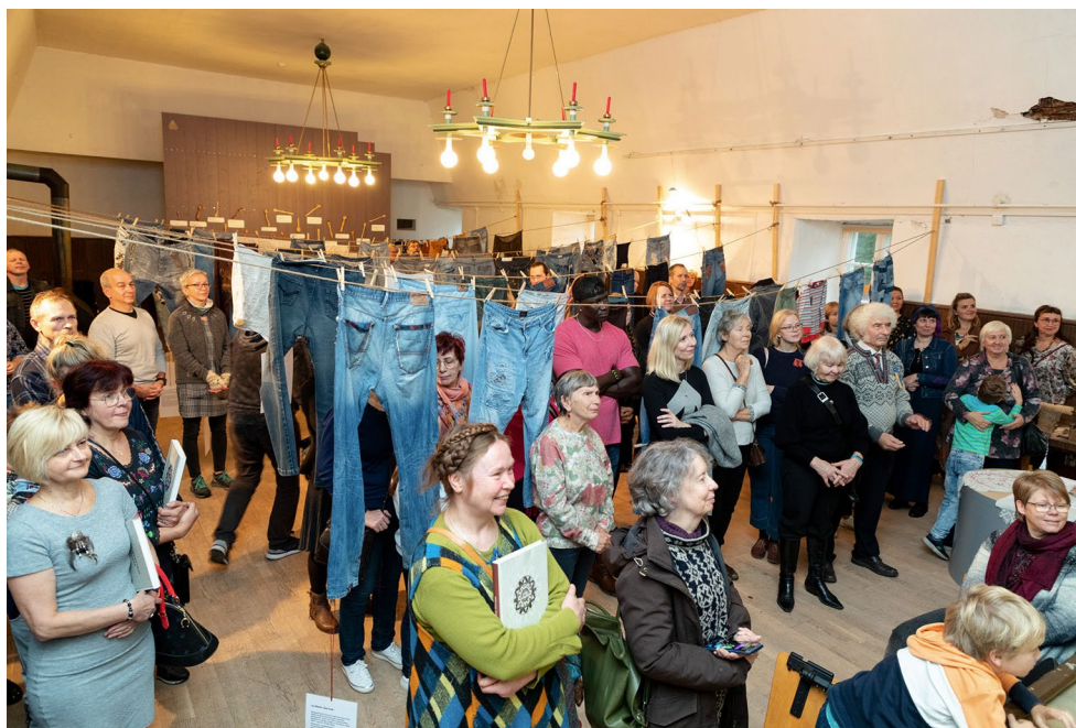
Näituse „Lipp lipi peal, lapp lapi peal“ avamine.