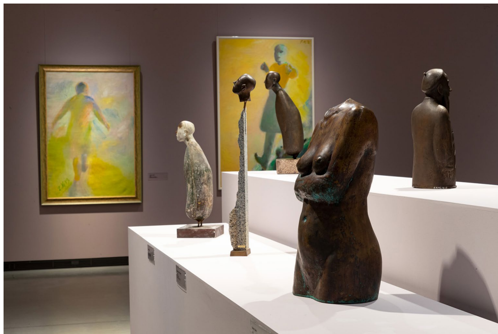
Vaade näitusele „Põlev mees. Peeter Mudist“.