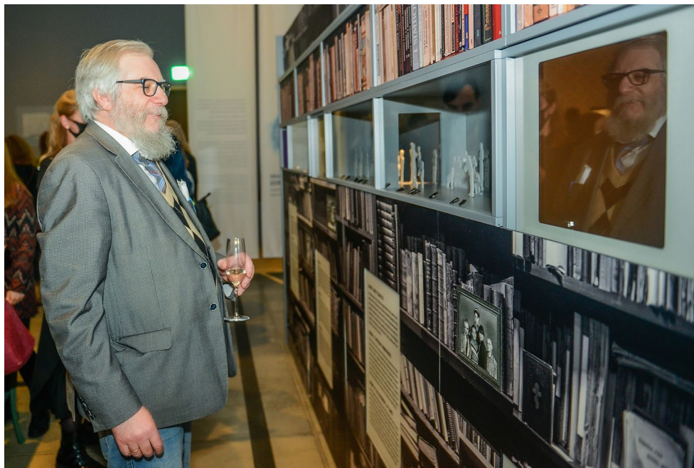
Näitus „Rännak Lotmani semiosfääris“ osalussaal.