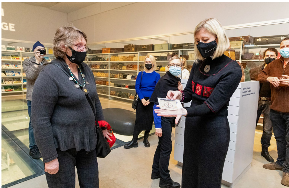
Avatud hoidla näituse „Praktiline ilu. Käekotid, rahakotid, kandekotid ja lahttaskud ERMi kogudest“ avamisel võtab direktor vastu kogudesse täienduse.