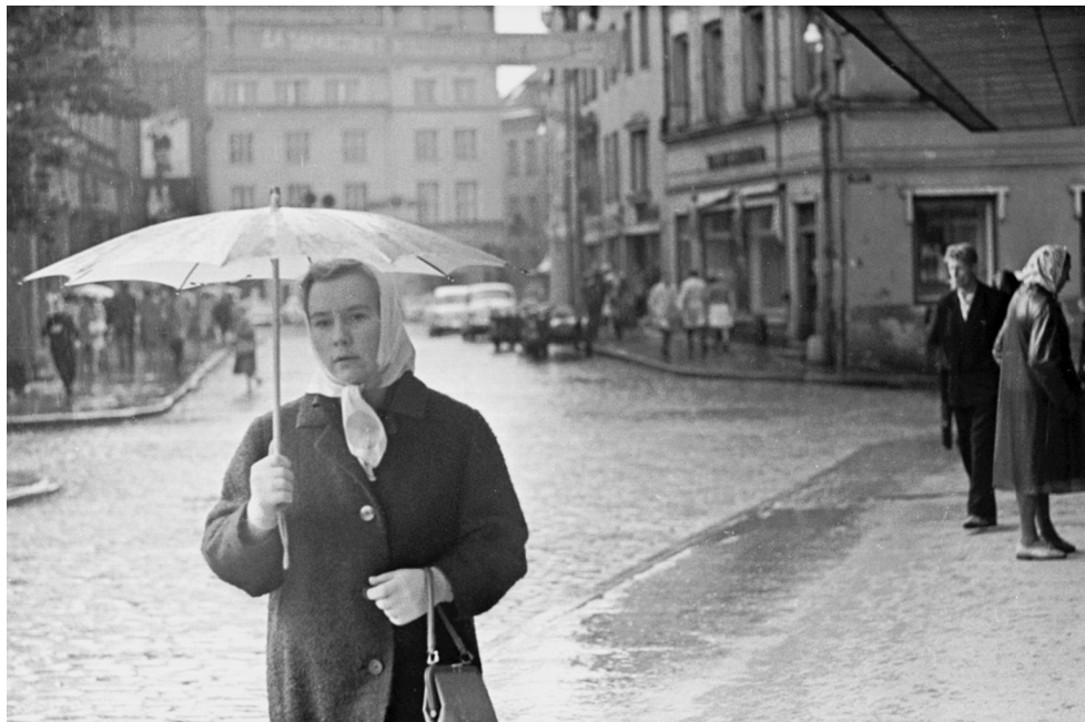
Vihm.