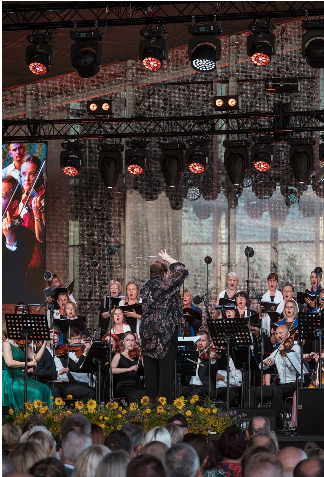
Taasiseseisvumispäeva kontsert ERMis.

Hästi läks käima igakuine rahvatantsude tutvustamine silla-alal nime all „ERM tant-sib“, mille eest nomineeris Eesti Rahvatantsu ja Rahvamuusika Selts 2023. aastal ERMi oma aasta sõbraks. Maarjamaa Filharmoonikute suurte kontsertidega tähistati Eesti taasiseseisvumispäeva augustis ning jõulupüha. Toetasime Petseri Eesti kooli vilistlaste kokkutulekut ja Siberis sündinud laste seltsingu ning Tartu Memento kohtumiste toimumist ERMis ning Töötukassa Ukraina põgenikele suunatud töömesse.