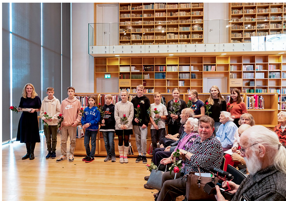
Kirjasaatjate võrgule töid nooruslikku särtsu Tartu Katoliku Hariduskeskuse õpilased.

Lugude kogumisel tegime keskkonna Rahvalood abil koostööd mitmete asutuste- ga: suvel kogusime sotsiaalministeeriumi ja sotsiaalkindlustusametiga lugusid Ukraina sõprade teemal ning sügisel päästeameti ja Naiskodukaitsega „Ole valmis!“ kriisilugusid. Neist esimesele saime 58 lugu ja teisele 28 lugu. Laulu- ja tantsupeo sihtasutus kut- sus ERMi oma partneriks noorte laulu- ja tantsupeo mälestuste kogumisel. Aastaga jõudis oma kogemused talletada 15 inimest ja kogumine jätkub 2023. aastal. Kõik Rah- valugude veebilehe kaudu saadetud lood jõuavad samuti ERMi arhiivi.