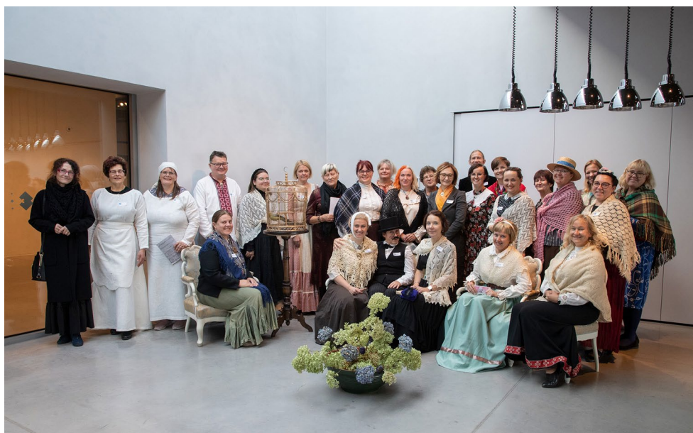
Ajaloo- ja muuseumiõpetajate ajarännak 1869. aastasse Lydia Jannseni salongi.