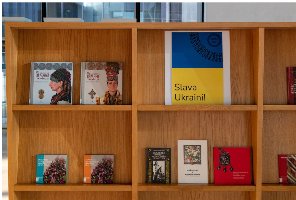
ERMi raamatukogu Ukraina-teemaline väljapanek.

2022. aastal kasvas ERMi raamatukogu 566 teaviku võrra (neist annetusel 430, ostud 83, vahetus 28, muu 25). Registreeritud lugejaid oli aasta lõpuks 494. Alates 4. aprillist kehtib uus RDA (Resource Description and Access) standarditele vastav raamatu kataloogimisjuhend, mis muutis ka mõnede kirjade vormistamise põhimõtteid. Järgult hakatakse RDA-le vastavaks muutama ka teiste teavikulaadide juhendeid.