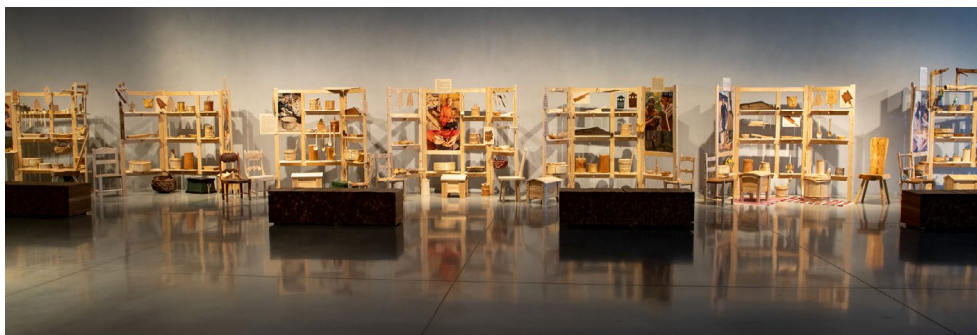
Oli puukäsitöö aasta. Näituse „Edeva Ereemiidi puutöökooli õpipoiste tööde väljapanek“. Kuraator ja kujundaja Meelis Kihulane

Töötube ja õppimisvõimalusi pakuti ka 4. juunil Eesti lipu päeva tähistamisel, mida ERM korraldas koos Eesti Laulu- ja Tantsupeo SA ja Riigikantseleiga. Loengukursused rahvakultuurist ja -kunstist toimusid Haapsalu Kolledži käsitöetehnoloogia ja disaini eriala tudengitele, Tartu Ülikooli Viljandi Kultuuriakadeemia rahvusliku tekstiili üliõpilastele jne. Ettekannetega rahvakultuurist ja -rõivastest esineti nii ERMis, Zoomi vahendusel kui ka üle Eesti. Maakondlikes pärimuskultuuri programmides ja teistes valdkonnanõukogudes osaleti liikmete, ekspertide ja konsultantidena. Küsimustelet rahvakultuuri vallas anti vastuseid pidevalt.