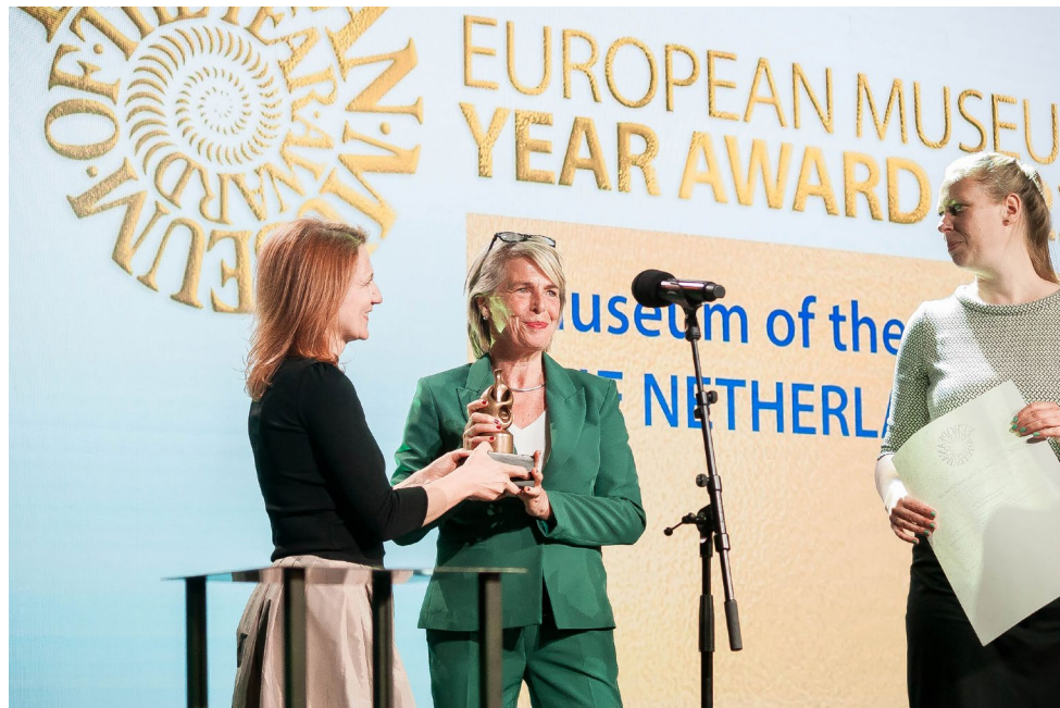
EMYA 2022 peauhind läks Hollandisse Museum of the Mind'ile.