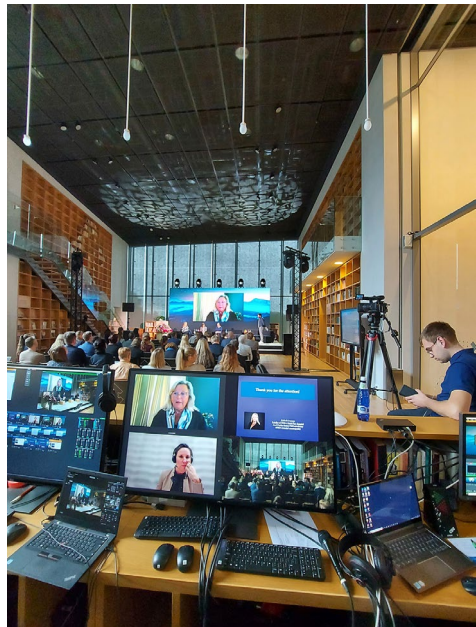
Raamatukogust konverentsisaaliks. Hübridseminar „Integration on local level, best practices in the Nordic and Baltic countries“.

Viinakööki kasutati usinasti nii firmaüritusteks kui pulmatseremooniade ja -pidude kohana, ERMi välialal mängiti kettagolfi ja petanki ning orienteeruti. Muuseumist startis taaskord nii Rally Estonia kui Tartu rattaralli.