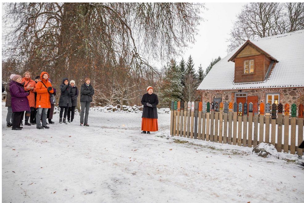
Heimtali muuseumi 35. aastapäeva tähistamine ja uue kindaaia avamine.

Olulisemate sündmustena leidsid aset Anu Raua jutukogu „Kuu ruuduga aken“ esitlus, MuuseumiÕÖ eriprogramm, XXXVI Pärnu Filmifestivali külaskäik ning Heimtali muuseumi 35. aastapäeva tähistamine.