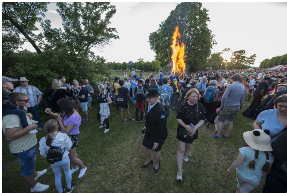
Jaanipäev Raadil.

Aasta jooksul jätkus koostöö teiste kultuuriasutuste ja -ühendustega Eestis ning välismaal, samuti Tartu Ülikooli ja kirjandusfestivaliga Prima Vista. Seltsi liikmete omavahelisi kontakte ja otsest suhtlemist toetasid kultuurireisid Soome Turu saarestikku ja Apuuliasse Itaalia saapakantsal. Reisidest võttis osa üle saja seltsiliikme. Aastate jooksul on koos reisides saadud lähedasemaks enam kui 30 maa kultuuriga.