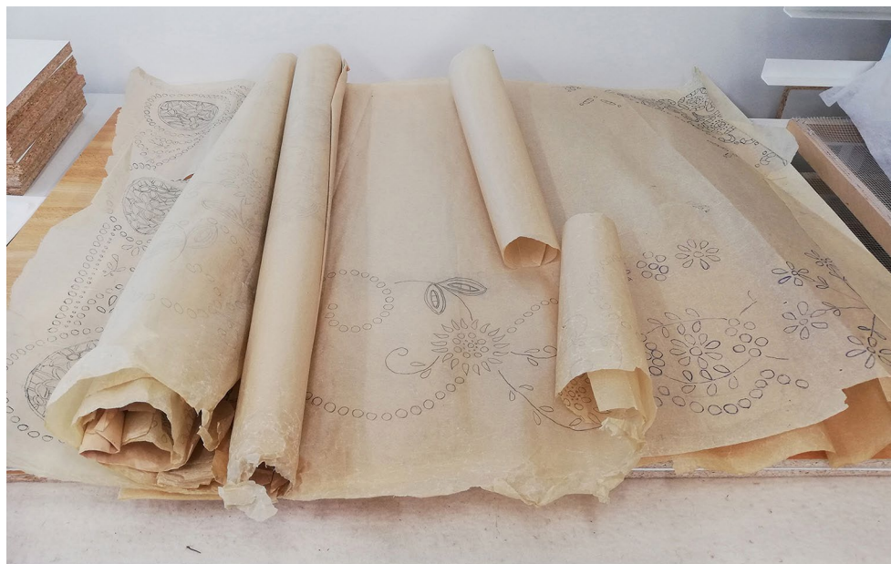
Mustrilehed enne conserveerimist.