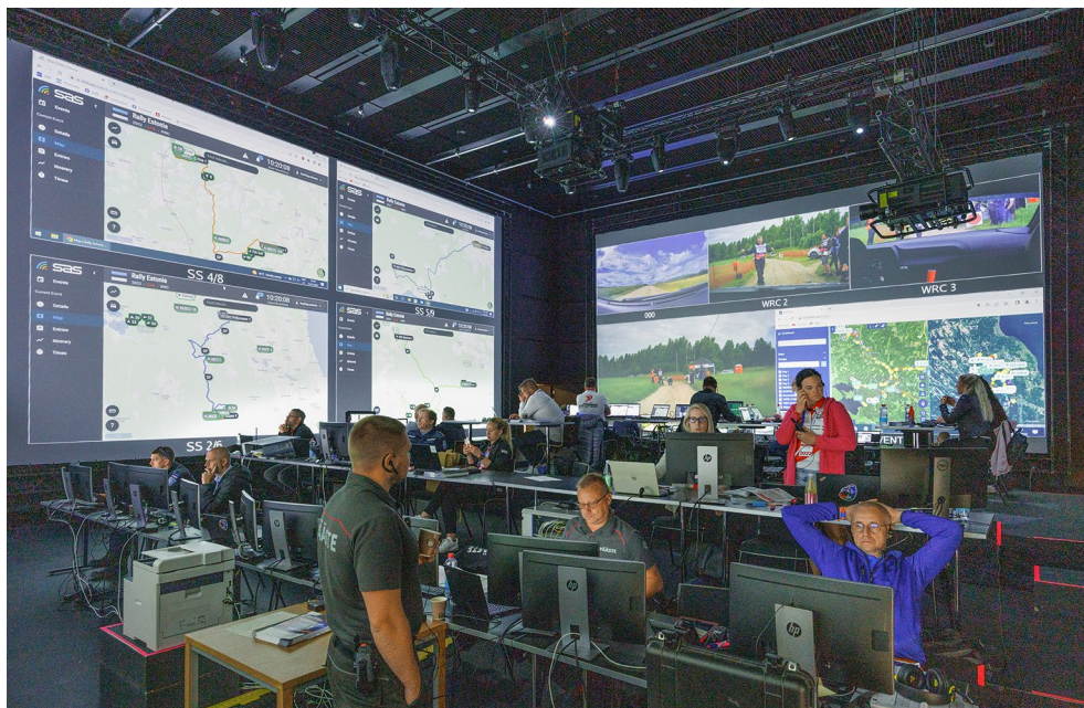
ERMi teatrisaalist on saanud Rally Estonia juhtimiskeskus.