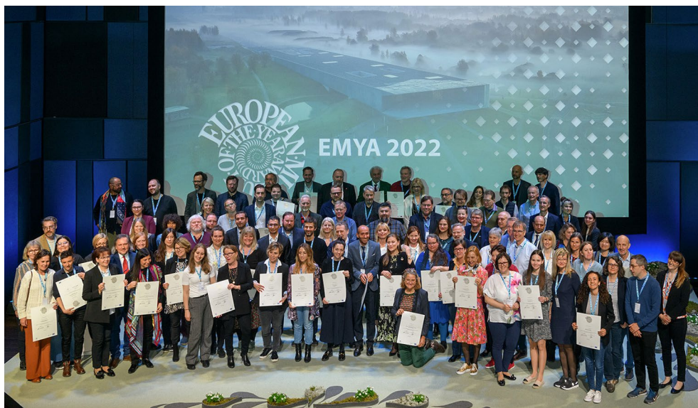
EMYA 2022 auhinnale nomineeritud muuseumid ERMis.

EMYA toimumine Eestis andis taas võimaluse tõsta Eesti muuseumid Euroopas esiplaanile oma uusarenduste, kaasava olemuse, külastajakesksuse ja innovatiivsuse poolest ning suurendas 2018. aastal EMYA-l auhinnatud ERMi nähtavust. Korraldajaid pärjati selle eest ka Eesti Konverentsibüroo aasta konverentsiteo auhinnaga ning peakorraldajat Kultuurkapitali aastaauhinnaga.