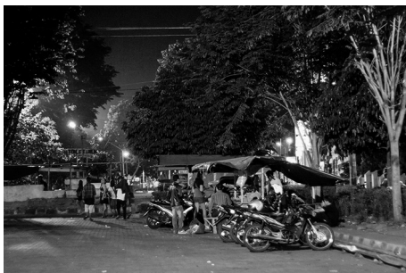
Foto 2. Waria 'de öine kogunemiskoht Yogyakarta.

Waria 'd tegelevad seksitööga sageli tööpoolest majanduslikel põhjustel, mis on kaudselt seotud perekonna toetuse puudumisega. Just seetõttu lähevad paljud waria 'd suurtesse linnadesse õnne otsima, jäädes samal ajal ilma erialasest väljaõppest. Ometi pole raha kaugeltki seksitöö paikades kogunemise ainus motivaator. Waria 'd kirjeldavad ööelu sageli kui olulist sotsiaalse suhtluse ja eneseesitluse väljundit. Just nendes paikades saab avalduda teatud tüüpi sooperformatiivsus,