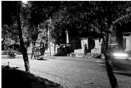
Foto 1. Waria varjumas munitsipaalpolitsei kartuses Surabaya linna waria 'de öises kogunemiskohas vanal Hiina kalmistul. Foto: Terje Toomistu, 2011

Aastatel 2010–2012 aset leidnud kahe intensiivse välitööetapi ajal ning mõne kuni 2018. aastani toimunud lühema külastuse vältel veetsin Indoneesias kokku 17 kuud. Lisaks osalusvaatlusele ja mitteametlikule suhtlusele ilusalongides, kultuuriüritustel ja ööelupaikades tegin Yogyakarta, Surabaya, Jayapura ja Sorongi linnas 42 poolstruktureeritud biograafilist intervjuud eri vanuses waria 'dega. Harilikult külastasin waria 'sid nende kodus või salongis, et saaksime rääkida privaatsetl. Kõik intervjuud peale kolme ingliskeelse on indoneesia keeles ja tegin nendest ka helisalvestused.