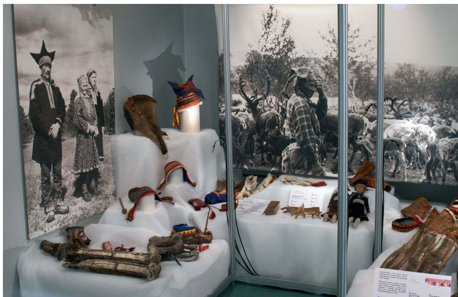
Foto 3. Eesti Rahva Muuseumi saami kogu esemed näitusel „Põhjala värvid“. Foto Arp Karm. ERM Fk 2911: 264.

konda, minetamata seejuures esteetiliselt nauditavust. „Perekondlike õhtusöögikommete inventuur 15 Euroopa riigis“ tähendas lisaks piltidele ka hoolikalt komponeeritud allkirju, milles sisalduvad taustandmed igavikustasid pisilugude ja tõsiasjadele osutamise kaudu piltidel nähtuva igapäevaelu.