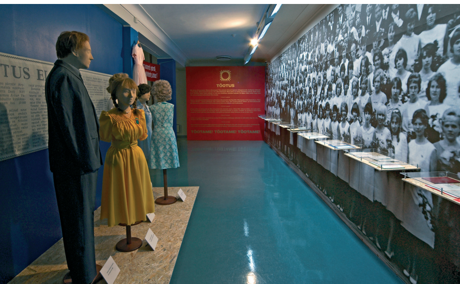
Foto 2. Vaade näitusele „Nõukogulik lähetus ellu – noorte suvepäevad Eesti NSVs“. Foto Merylin Suve.

jälgiti valgustingimusi väga hoolikalt. Näitust eksponeeriti ka Võrumaa Muuseumis (Võru folkloorifestivali ajal) ja Narva Muuseumis (muuseumide festivalil) ning ka sealsete valgustingimuste kontroll oli eelduseks, et näitust üleüldse eksponeerida lubatakse.