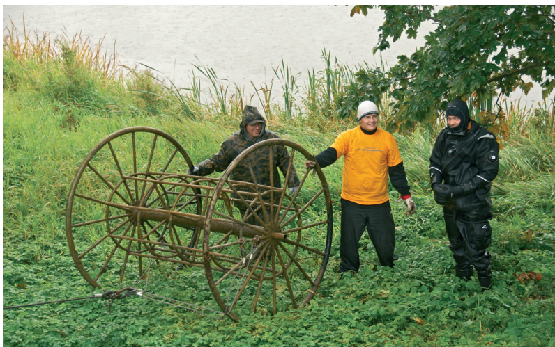
Foto 5. 15. septembril 2007 toimus aktsioon „Raadi järv puhtaks!“. Tartu sukel- dumisklubi Maremark liikmed leiuga Raadist järve põhjast. ERM Fk 2911: 422.