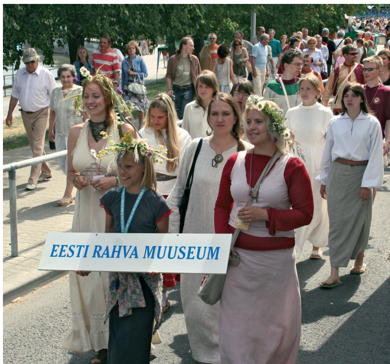
Foto 2. Eesti Rahva Muuseum Tartu rahvusvahelistel hansapäevadel juulis 2006. Foto Dein-Tom Tõnsing.

30. juunil külastas muuseumi riigikogu aseesimees Maret Mari-puu, kellele tutvustati muuseumi kogusid ja anti ülevaate uue peahoone ehitamisega seotud ettevalmistustöödest.