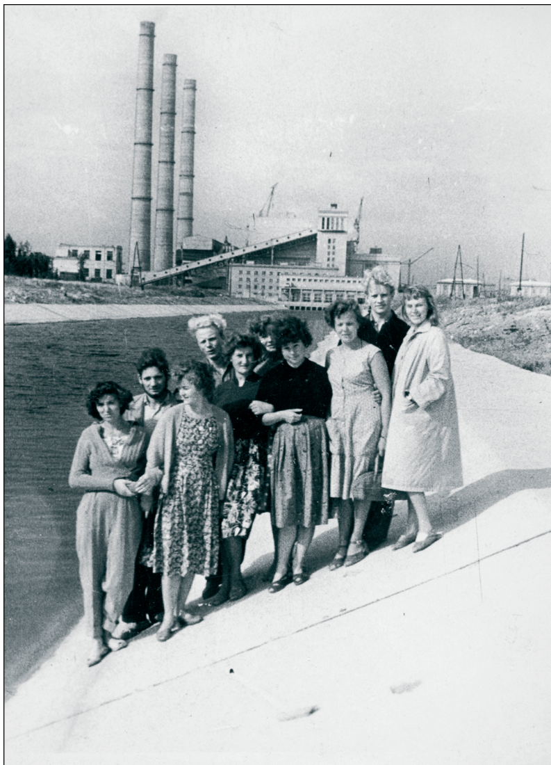
Foto 3. Noored Balti Soojuselektrijaama ehitusel. 1960. ERM Fk 2861: 302.

Noorsoo nõukogulikus töökasvatuses etendasid olulist osa komsomoli löök-ehitused. 1958. aastal kuulutati löökehituseks ka Balti Soojuselektrijaam.