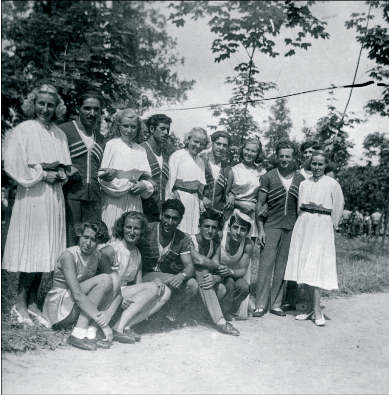
Foto 4. Üleliidulisest kehakultuurlaste paraadist osavõtjad 1954. aastal Moskvast – eesti võimlejaneid noormeestega sõbralikest vennasvabariikidest.

Sport, eriti võistlussport, politiseerus nagu muu elugi. Valitses põhimõte, et kehaline kasvatus on kommunistliku kasvatusel lahutamatu koostisosa. „Nõukogude ühiskonnas ei tehta sporti spordi pärast või üksikute lõbuks. Kehakultuur ja sport on meil masside kasvatamise vahendiks. Sport peab kasvatama terveid, tugevaid, julgeid ja elurõõmsaid nõukogude inimesi, kes on võimelised ja väärilised minema vastu kommunismi heledale tulevikule.“ (Illisson 1949: 6)