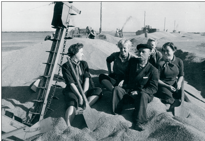
Foto 2. Üliõpilased uudismaal Kasahstanis. 1958. ERM Fk 2861: 27.

1958. aastal 18 kehtestati kõrgkooli astumiseks uued reeglid, millega anti eelis neile noortele, kellel oli kaheaastane tööstaaž tööstuses. Need, kellel seda ei olnud, pidid terve esimese aasta õppimise kõrvalt töötama. Tollaste tudengite meenutustes räägitakse sellest kui ühest tolle aja absurdusest: selle asemel, et eriala õppida, tuli minna ehitusele või tehasesse, kus oskuste puudumisel ei saanud midagi mõistlikku teha. Ka 1961. aastal ajalooõpinguid alustanud naine pidi selle katsumuse läbi tegema: Õppetöö oli õhtuti ja hommikuti töötati. Selline periood kestis ainult paar aastat. Enamus meie kursust läks tööle õmblusvabrikusse „Sangar“, paar inimest ülikooli ehitajaoskonda, nii et mina töötasin maalina esimesel aastal. [...] Üks päev oli minu arvates õppetööst vaba, nii et 4 päeval nädalas olid