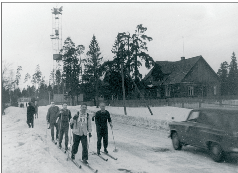
Foto 4. Eesti NSV Ministrite Nõukogu Asjadevalitsuse suusasektsiooni matkajad, 1962. ERM Fk 2827: 515.

Omast kohast oli too matk huvitavgi. Mitte niivõrd agitatsiooni seisukohalt, vaid suusatamise (suusamatka) seisukohalt. (KV 993: 52)