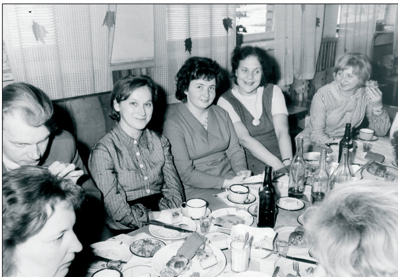
Foto 2. Tartu 3. Lastepäevakodu töötajad pidulauas, 1965. ERM Fk 2853: 80.

Kolleegidega tähistati ka isiklike elu sündmusi, just sünnipäevi. Samuti kaeti pidulaud ka osade aastaringi tähtpäevade puhul.