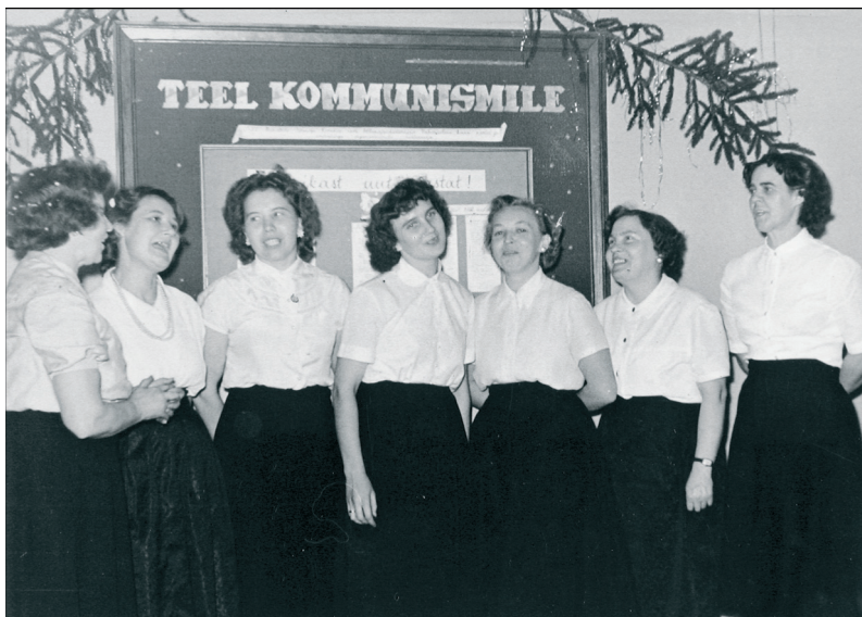
Foto 1. EPT Vabariikliku Baasi naisansambel, 1960ndate algus. ERM Fk 2827: 41.

Pilt heast ja üksteist toetavast kollektiivist on biograafilistes jutustustes väga levinud. Eriliselt hea meelega meenutatakse osalemist isetegevuslikes ringides, peamiselt ansamblites ja koorides.